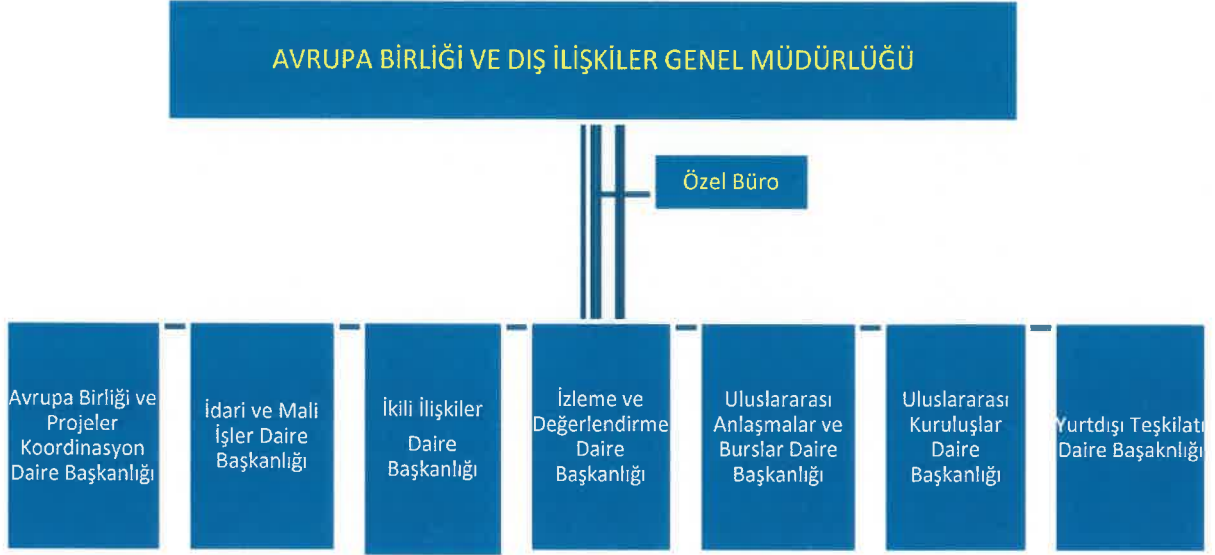
Şekil 1: Birim Teşkilat ve Organizasyon Yapısı

Şekil 1’de verildiği üzere Avrupa Birliği ve Projeler Koordinasyon Daire Başkanlığı, İdari ve Mali İşler Daire Başkanlığı, İkili İlişkiler Daire Başkanlığı, İzleme ve Değerlendirme Daire Başkanlığı, Uluslararası Anlaşmalar ve Burslar Daire Başkanlığı, Uluslararası Kuruluşlar Daire Başkanlığı ve Yurtdışı Teşkilat Daire Başkanlığı olmak üzere yedi daire başkanlığı ve bir özel bürodan oluşmaktadır.